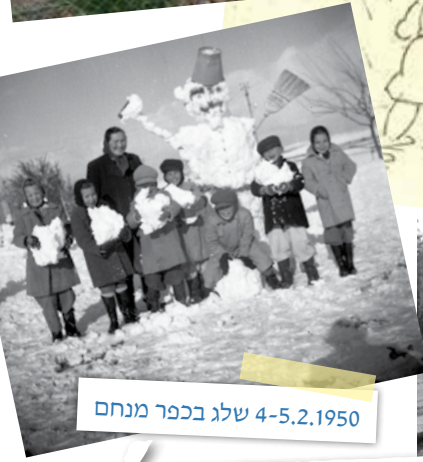
4-5.2.1950 שלג בכפר מנחם